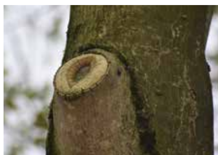
Goed geheelde snoeiwond

In de tijdelijk kroon hoeven alleen takken te worden verwijderd die de vrije doorgang belemmeren. Probleemtakken zijn bijvoorbeeld dikke takken (takken die in de takkraag dikker zijn dan 50% van de stamdiameter), dubbele toppen (takken die concurreren met de doorgaande spil) en dode en beschadigde takken.