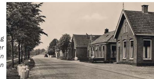
Oude foto Nieuweweg hoek Mienscheer met links de tramlijn Groningen-Drachten

Petgaten zijn ontstaan door het afgraven van laagveen voor de winning van turf als brandstof. Rond 1900 waren in de laagveengebieden in het Westerkwartier uitgestrekte moerasgebieden met honderden rechthoekige petgaten. Tussen de petgaten lag een legakker: een smalle strook land waarop de uitgeschepte turf te drogen werd gelegd. In een periode van droogte gebruikten boeren het water uit dit petgat als drinkwater voor hun vee.