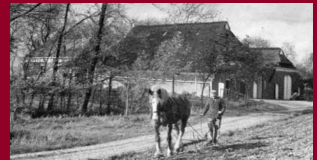
Historische foto van Beukemoa's Ploatske.

Tijdens Wereldoorlog II woonde vanaf 1941 de familie Bouwman op Beukemoa's Ploatske. In de nacht van 20 op 21 juni 1942 zagen zij tot hun afgrijzen een vliegtuig neerstorten op de akker naast hun boerderij. Naar later bleek was dit de bommenwerper Halifax W 1114MP-F van de vijftientigjarige gezagvoerder Howard Norfolk, die kort daarvoor zijn lading had afgeworpen boven Duitsland. Bij zijn retourvlucht raakte het vliegtuig gehavend door de luchtafweer van Emden. Toen vervolgens een nachtjager de aangeschoten bommenwerper onder vuur nam stortte deze neer bij Beukemoa's Ploatske. Hierbij kwamen drie van de zeven bemanningsleden - waaronder de gezagvoerder - om het leven. Zij liggen begraven op de begraafplaats in Ulrum.