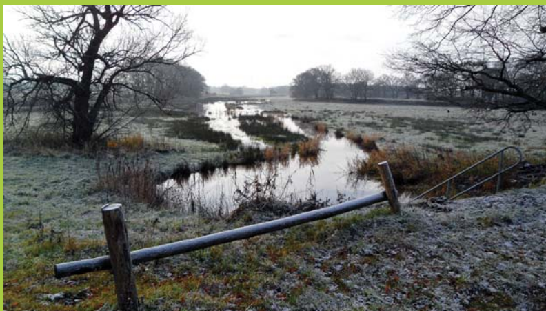
Ruiten Aa dal in de winter.