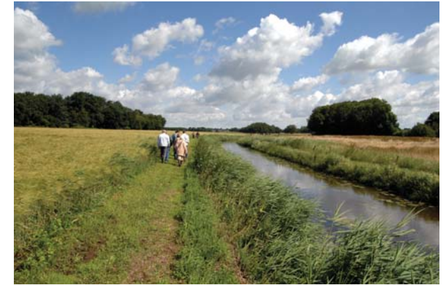
De Mussel Aa.

Naast de reeds genoemde Kiebaarg liggen er in het gebied tussen Hõfte en Ter Wupping nog meer oude rivierduinen, waaronder de Roegebaarg en de Hõrntoene.