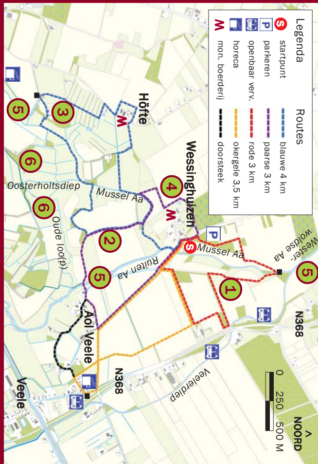
Topografische kaart: copyright © 2009, Dienst voor het kadaster en openbare registers, Apeldoorn.

foto's: Jon Bakker, foto geelgors: André Eijkenaar.