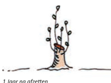
1 Jaar na afzetten