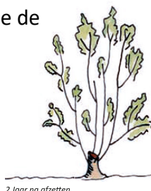
2 Jaar na afzetten