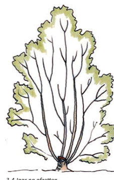
3-4 Jaar na afzetten